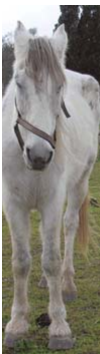
Hidalgo , ein abgemagertes Neuzugang auf der Finca.